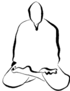
Posizione del Loto

Tirate verso di voi il piede sinistro e mettete il tallone sull'inguine con la pianta appoggiata contro la coscia destra. Mettete il bordo esterno del piede destro tra il polpaccio e la coscia della gamba sinistra. Qualora fosse particolarmente faticoso assumere tale posizione, detta "del Loto ", anziché porre il piede sinistro poggiato sulla gamba destra, potrete posizionarlo al di sotto di essa, assumendo la "posizione del Mezzo-Loto ".