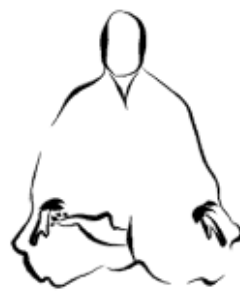
Posizione del Mezzo-Loto

Piegatevi in avanti e tirate in dentro il cuscino sotto il sedere in modo che sia in posizione comoda. Sollevate e raddrizzate il tronco con la schiena leggermente arcuata cosicché lo stomaco e il petto siano spinti in avanti.